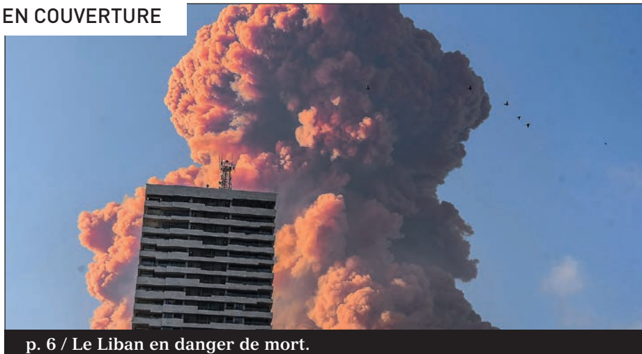
p. 6 / Le Liban en danger de mort.