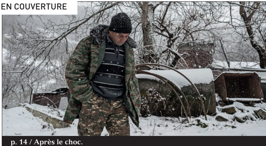
p. 14 / Après le choc.