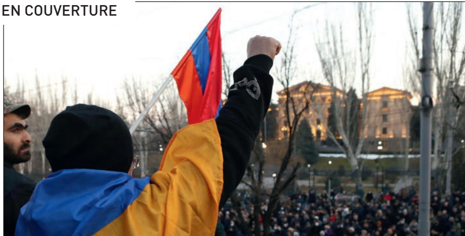
p. 12/ Où va l'Arménie ?